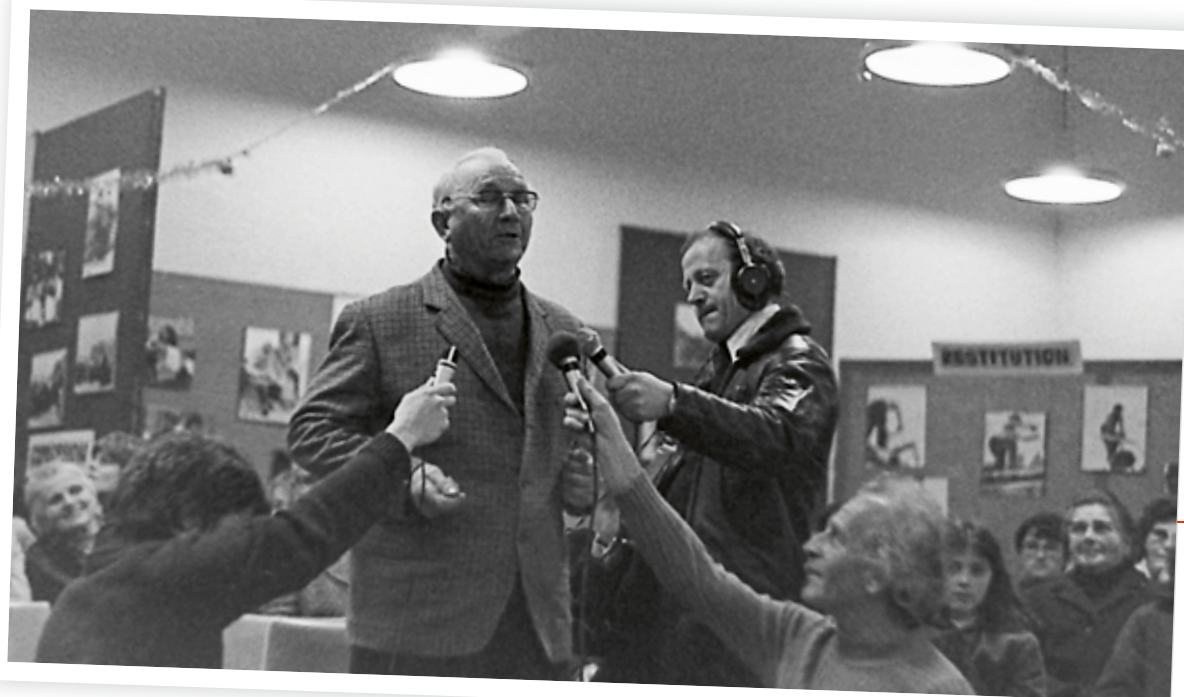
Les membres de L'Aigail ont procédé à de nombreux enregistrements de la mémoire populaire.

En 1975, l'Aigail inaugure son Centre de documentation de la tradition orale en milieu rural, construit dans le pro-