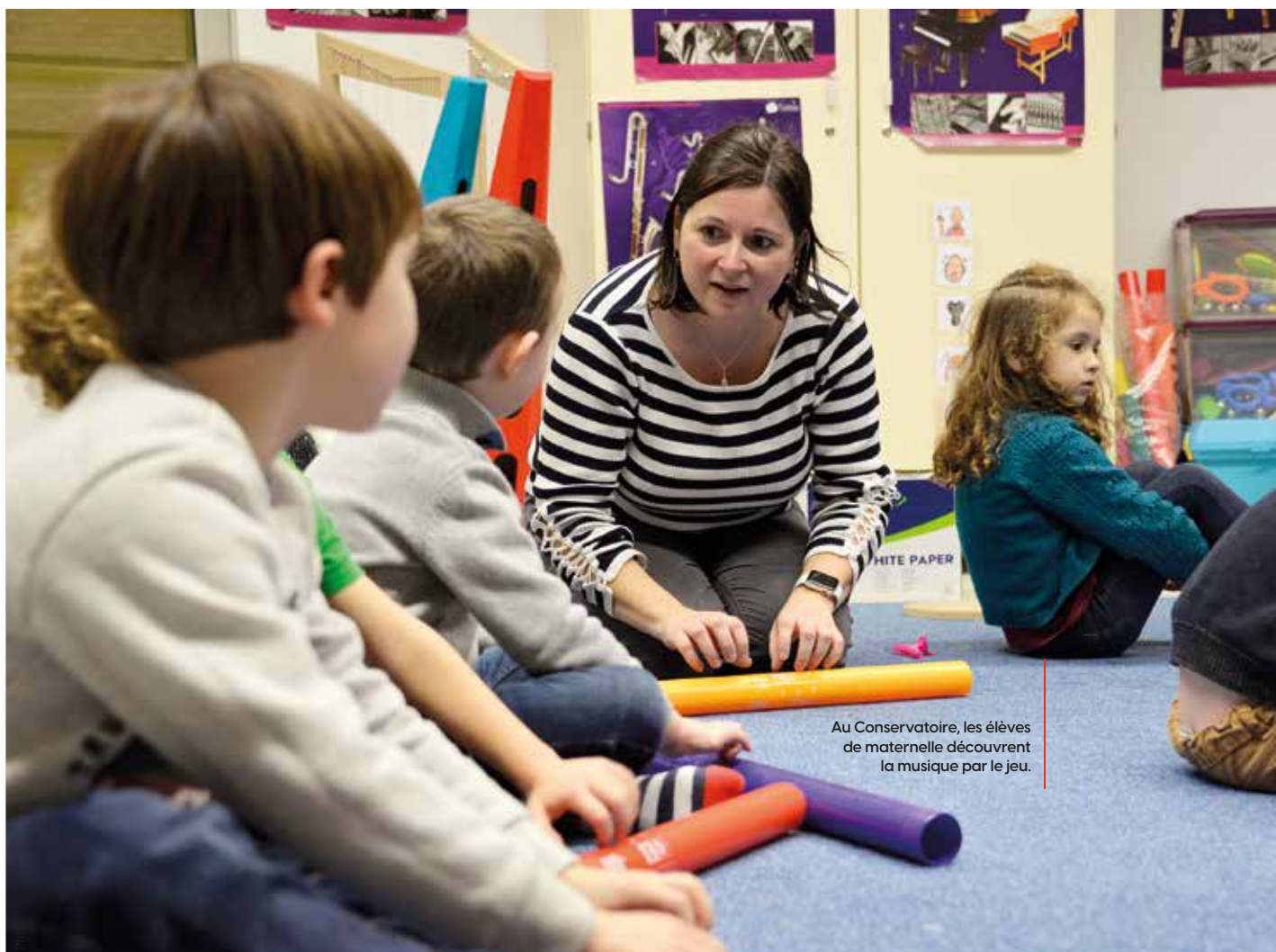
Au Conservatoire, les élèves de maternelle découvrent la musique par le jeu.