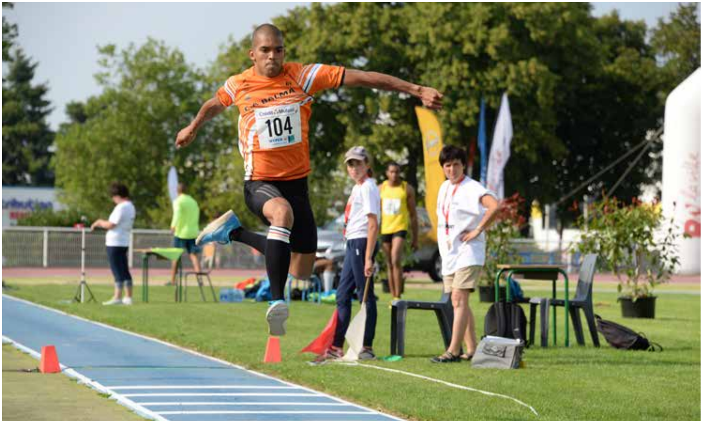
Des champions de renommée mondiale seront présents au meeting.

L'Athletic club La Roche-sur-Yon (ACLR) organise son meeting élite le mercredi 22 juillet, à partir de 18 h, au stade Jules-Ladoumègue.