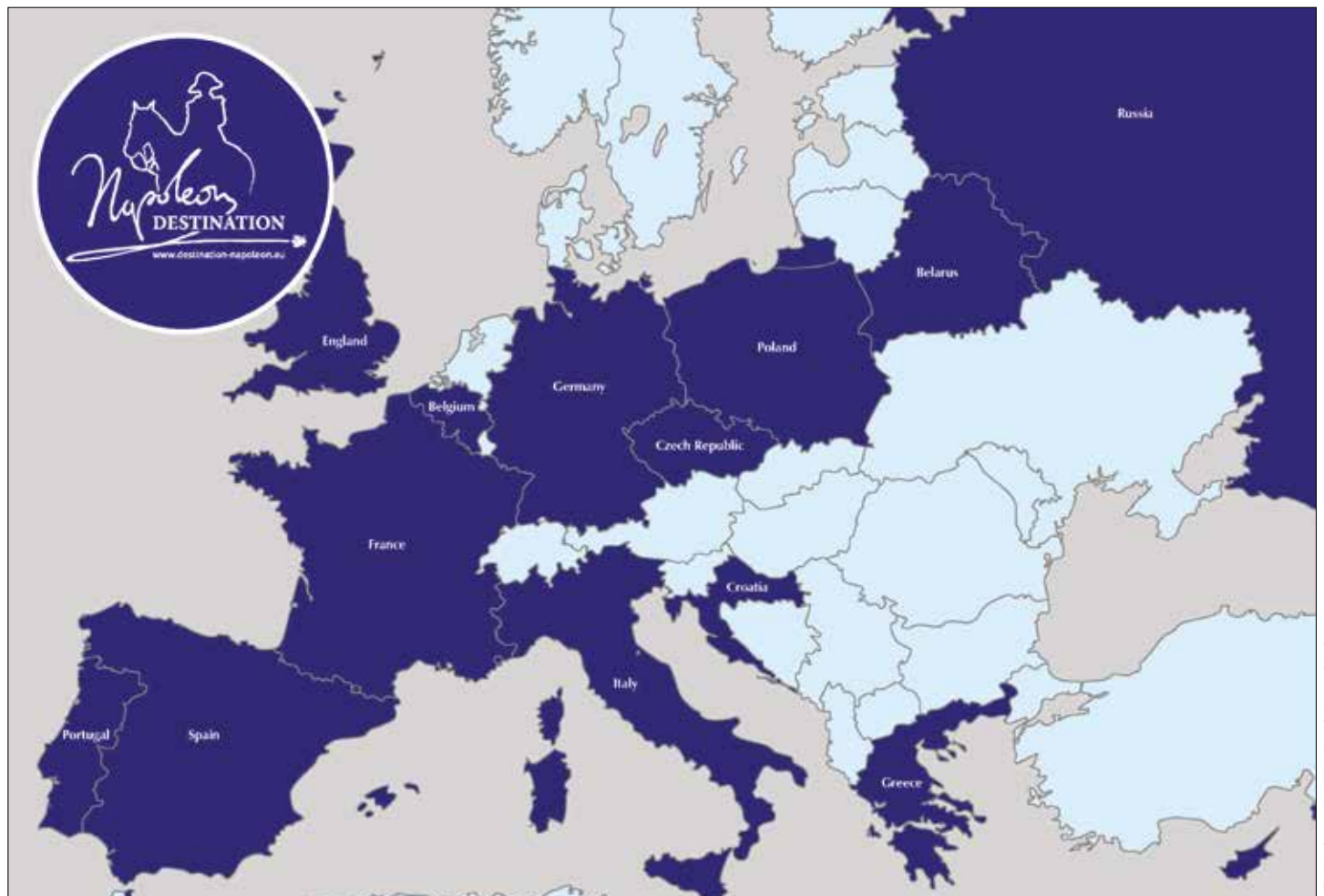
La « Destination Napoleon » propose de parcourir l'Europe du Portugal à la Russie.