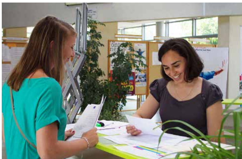
Un accueil individualisé est prévu pour les futurs étudiants.