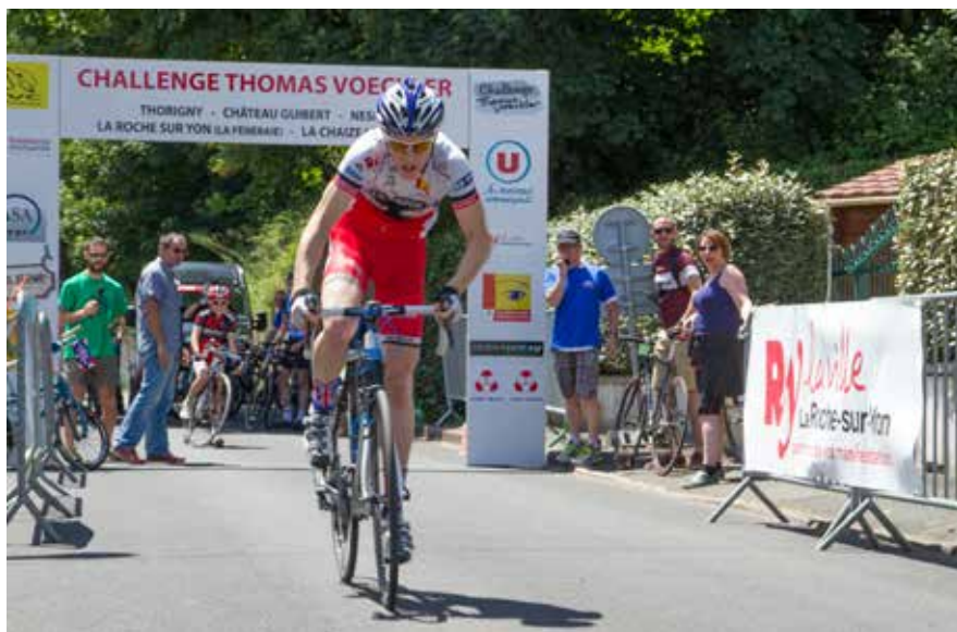
La 4 e manche du Challenge Thomas Voeckler partira le 15 août de La Féneraie.

Chaque année, de mai à septembre, La Roche Vendée Cyclisme (RVC) organise le challenge qui porte le nom de son plus célèbre et populaire licencié, Thomas Voeckler. Ouvert exclusivement aux minimes et cadets, l'événement se déroule sur cinq épreuves. Après Thorigny, Château-Guibert, Nesmy et avant la finale de La Chaize-le-Vicomte, le village de La Féneraie à La Roche-sur-Yon accueille la 4 e manche de cette édition 2015. Rendez-vous le samedi 15 août, à partir de 10 h.