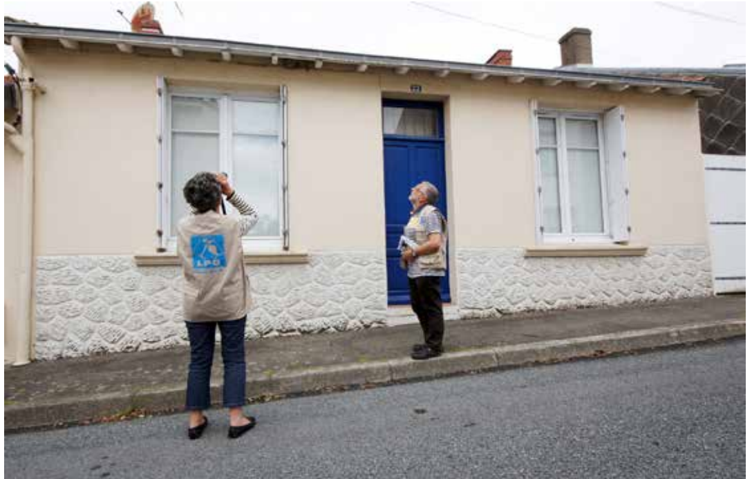
Les bénévoles de la LPO recensent les nids d'hirondelles.

Pourtant, les hirondelles sont protégées par la loi du 10 juillet 1976 relative à la protection de la nature : on ne