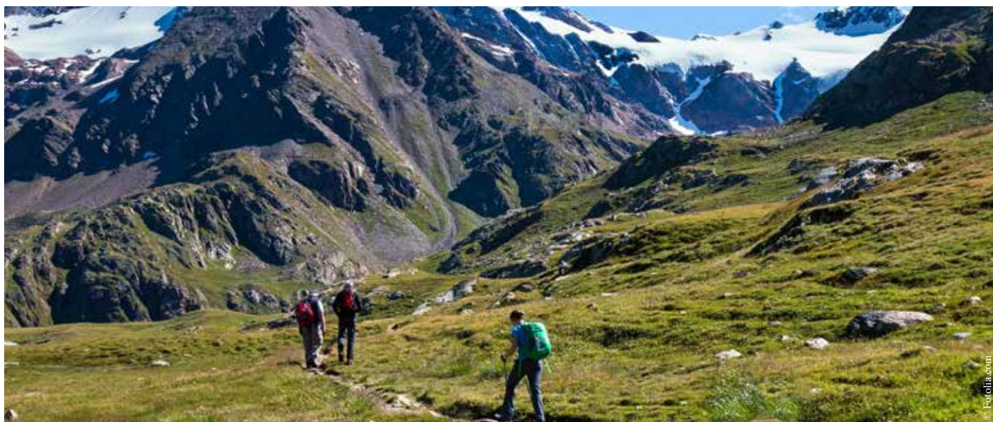
Le Club alpin de Vendée propose diverses randonnées en montagne et en plaine.

Afin de se faire connaître et d'accueillir de nouveaux pratiquants, le Club alpin de Vendée organise des portes ouvertes le samedi 5 septembre, de 9 h 30 à 12 h 30, et le lundi 7 septembre, de 18 h 30 à 20 h 30, à la salle Rivoli. Au programme : escalade en salle et randonnée en plaine.