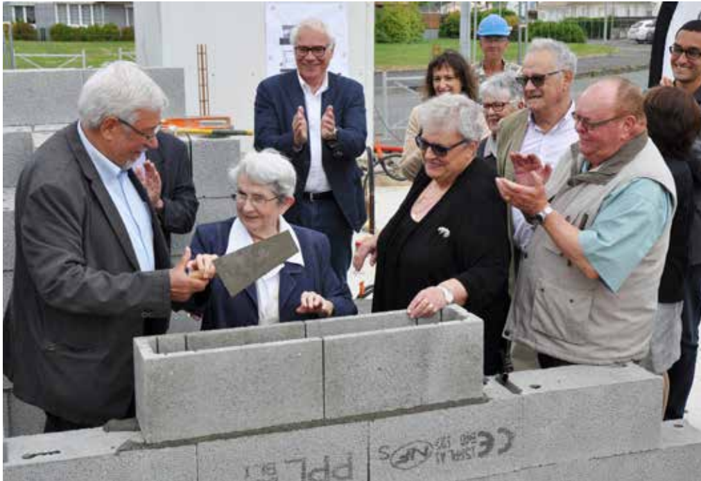
Pose de la première pierre en présence des acteurs du projet.

La première pierre de 14 logements locatifs sociaux rue des Étangs, au cœur du quartier de La Généraudière, a été posée le 11 juin dernier. Ce projet, à l'initiative du groupe Vivre et vieillir dans son quartier et réalisé par Vendée Logement, propose une alternative à la maison de retraite pour les personnes âgées qui souhaitent rester dans leur quartier.