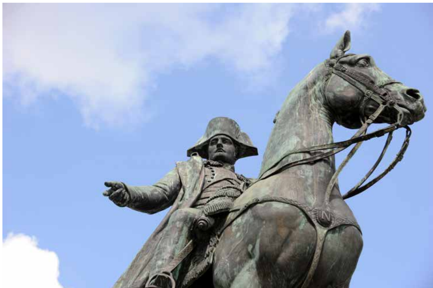
La Roche-sur-Yon, ville-étape de l'itinéraire culturel européen.

La Fédération européenne des cités napoléoniennes, née à La Roche-sur-Yon lors du bicentenaire de la ville en 2004, vient de recevoir le label Itinéraire culturel européen* pour son projet « Destination Napoleon ». (L'absence d'accent sur le « e » de Napoleon renvoie au caractère international du projet.)