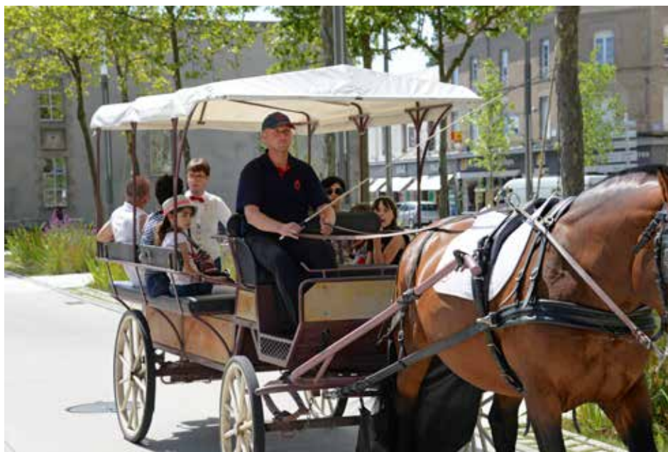
Découvrez la ville en calèche jusqu'au 29 août.