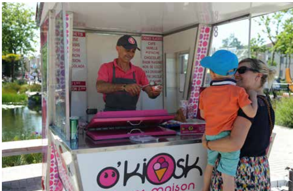
Profitez d'une pause gourmande sur la place Napoléon.

Pendant l'été, l'Office de tourisme anime un point information sur la place Napoléon. Vous y trouverez des plans, les principales brochures et également une billetterie pour la promenade en calèche (lire encadré). Il vous accueille également au 7, place du Marché sur des plages horaires élargies (du lundi au samedi, de 10 h à 19 h, et le dimanche, de 14 h à 18 h) et saura vous conseiller et répondre à vos questions.