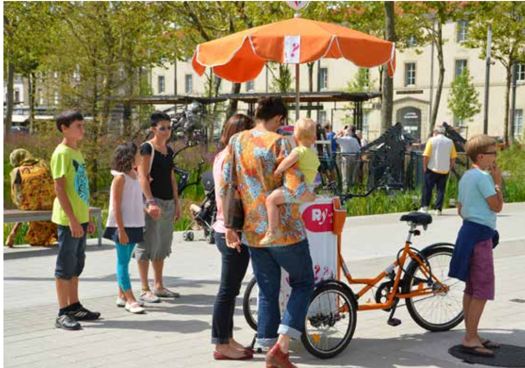
Cet été, découvrez les offres de l'Office de tourisme sur la place Napoléon.

Le service billetterie répondra également à votre soif de spectacles ! Et si vous n'avez pas encore