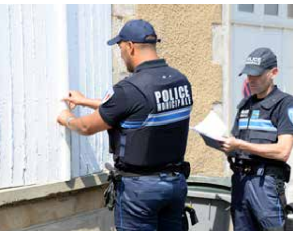
La Police municipale vérifie que les ouvertures sont bien fermées.

Cet été, la Police nationale et la Police municipale de La Roche-sur-Yon renouvellent l'opération « Tranquillité vacances ».