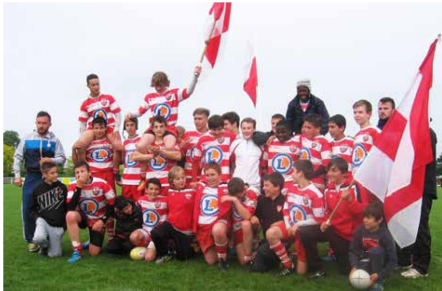
L'équipe des U14 du FCY rugby.

Une chose est certaine : il s'agit d'un titre de champion de France et ils s'en souviendront toute leur vie.