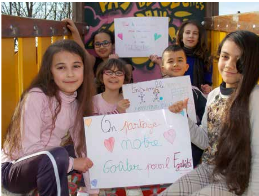
Les élèves ont travaillé à l'élaboration des slogans qui seront présentés pendant la Semaine des droits de l'enfant.

En septembre, le CMJ lancera un concours photo dans les établissements scolaires, les accueils de loisirs et périscolaires de la ville et de l'agglomération. Les lauréats seront primés à l'occasion de la Journée internationale des droits de l'enfant en novembre.