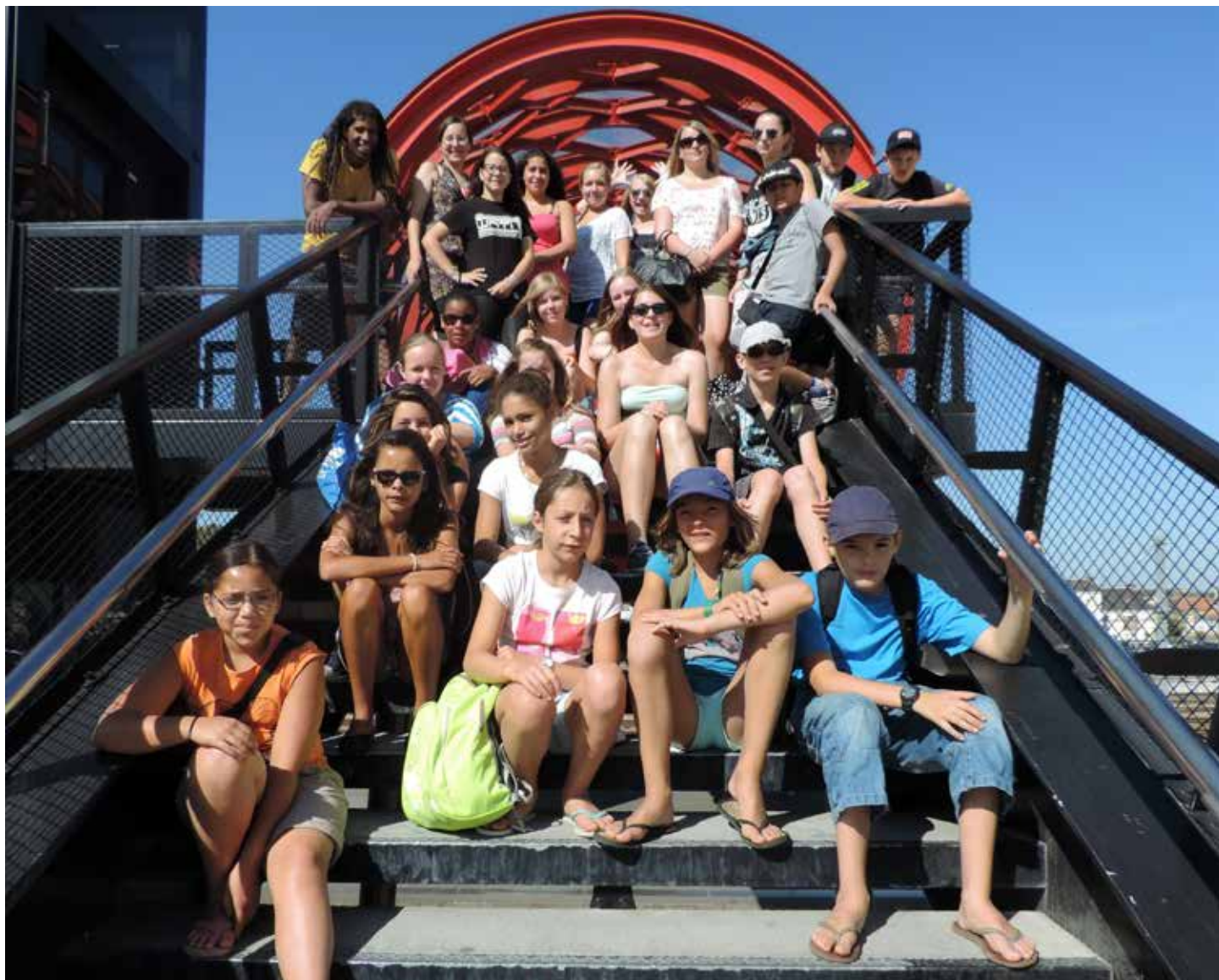
Les jeunes Allemands de Gummersbach ont été accueillis en 2013 à La Roche-sur-Yon.

Dans le cadre des stages artistiques « Creat'Yon » mis en place dans les maisons de quartier pendant les vacances scolaires, La Roche-sur-Yon accueille cet été des jeunes des villes jumelles de Gummersbach (Allemagne) et de Cáceres (Espagne).