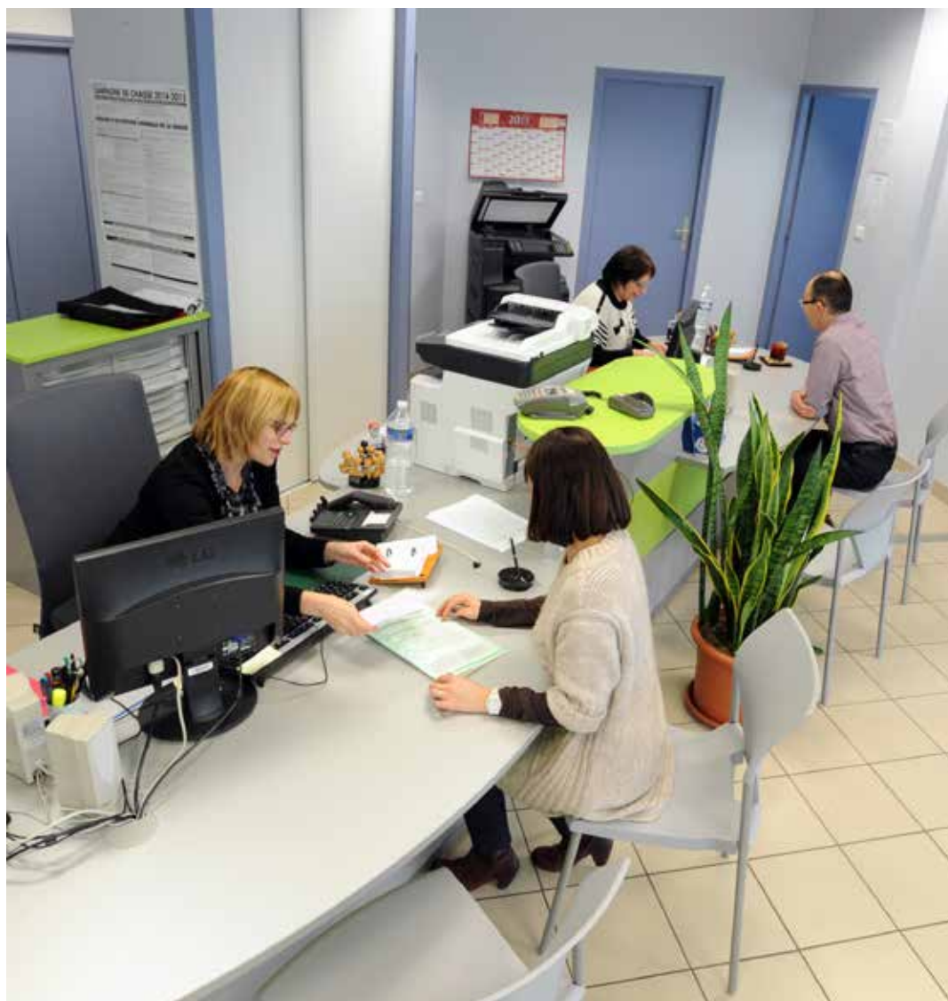
Accueil à la mairie annexe de La Garenne.

Du lundi 6 juillet au vendredi 28 août : ouverture de 8 h 30 à 12 h 30 et de 13 h 30 à 17 h.