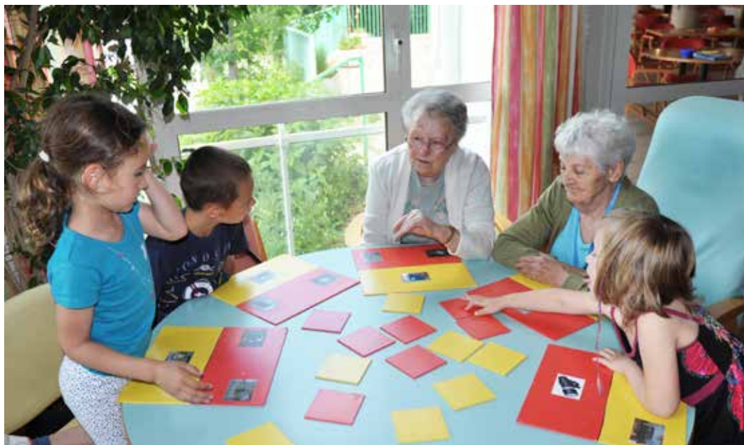
Anciens et enfants testent leur jeu de « Memory ».

« L'intérêt est double, à la fois pour les enfants et pour les résidents,