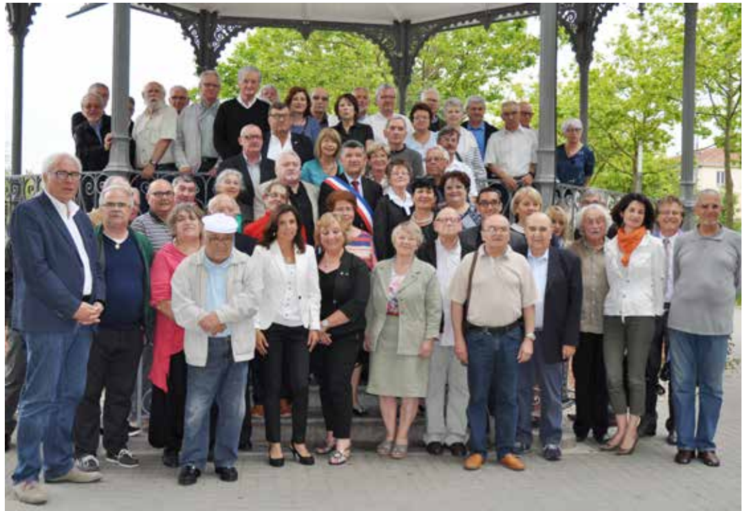
Un hommage a été rendu le 11 juin dernier aux huit conseillers sages sortants.