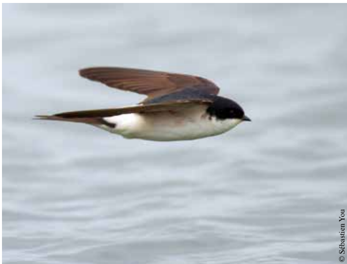
Hirondelle des fenêtres.