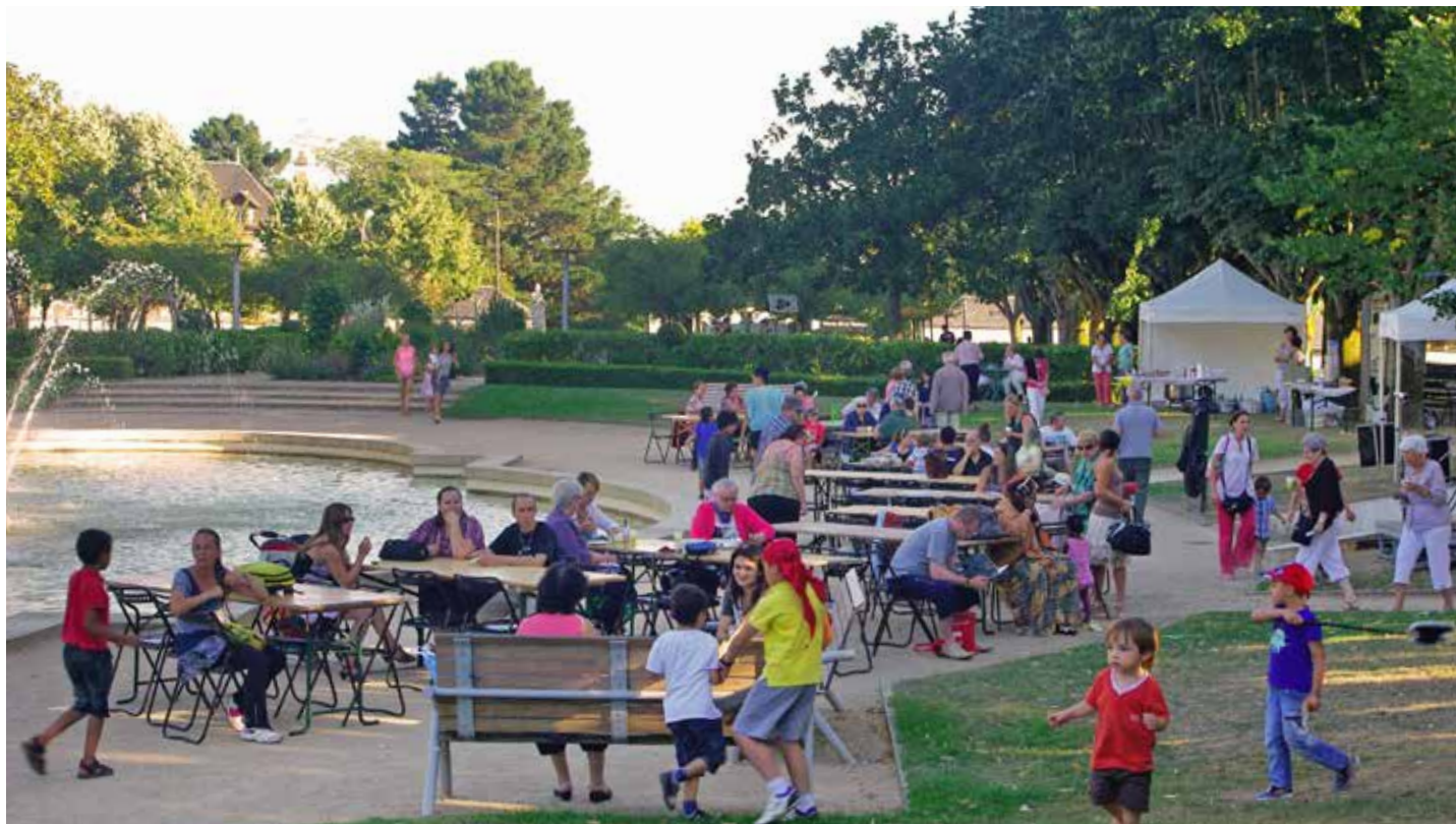
Repas et animations au square Bayard.

Contact : renseignements à la maison de quartier du Pont-Morineau, au 02 51 37 88 05