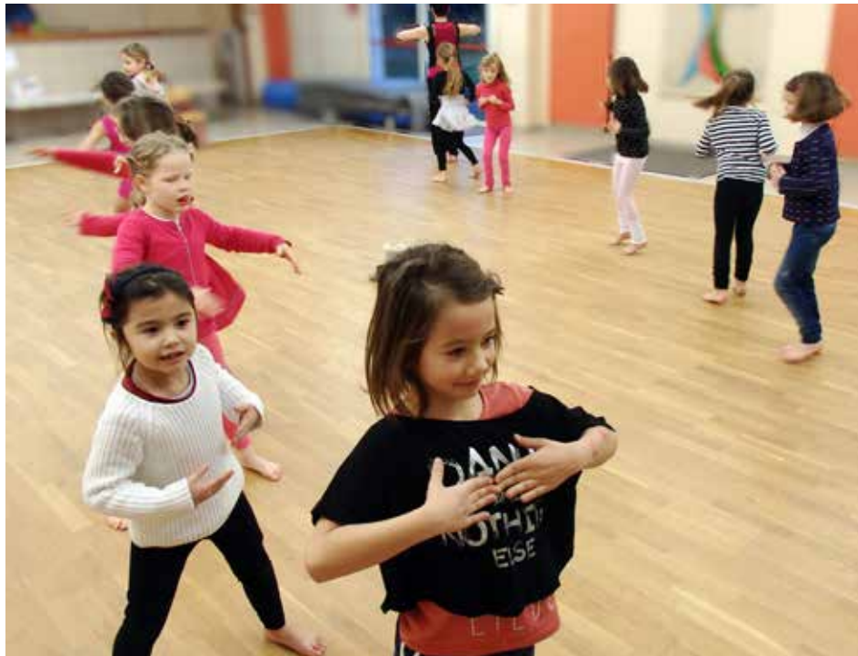
L'atelier danse pour les enfants.

Inscriptions possibles dès maintenant ou le mercredi 2 septembre, de 9 h à 18 h, à la maison de quartier du Bourg-sous-La Roche.