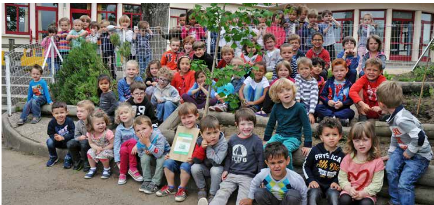
Les élèves de l'école maternelle Léonce-Guard ont planté leur ginkgo biloba dans le jardin potager de la cour.

Les écoles Jeanne-d'Arc, Notre-Dame, Angelmière et Léonce-Guard ainsi que le lycée des Établières de La Roche-sur-Yon font partie des 40 établissements scolaires vendéens labellisés « Génération écoresponsable ». Créée par Trivalis, cette distinction récompense leur engagement en faveur du développement durable.