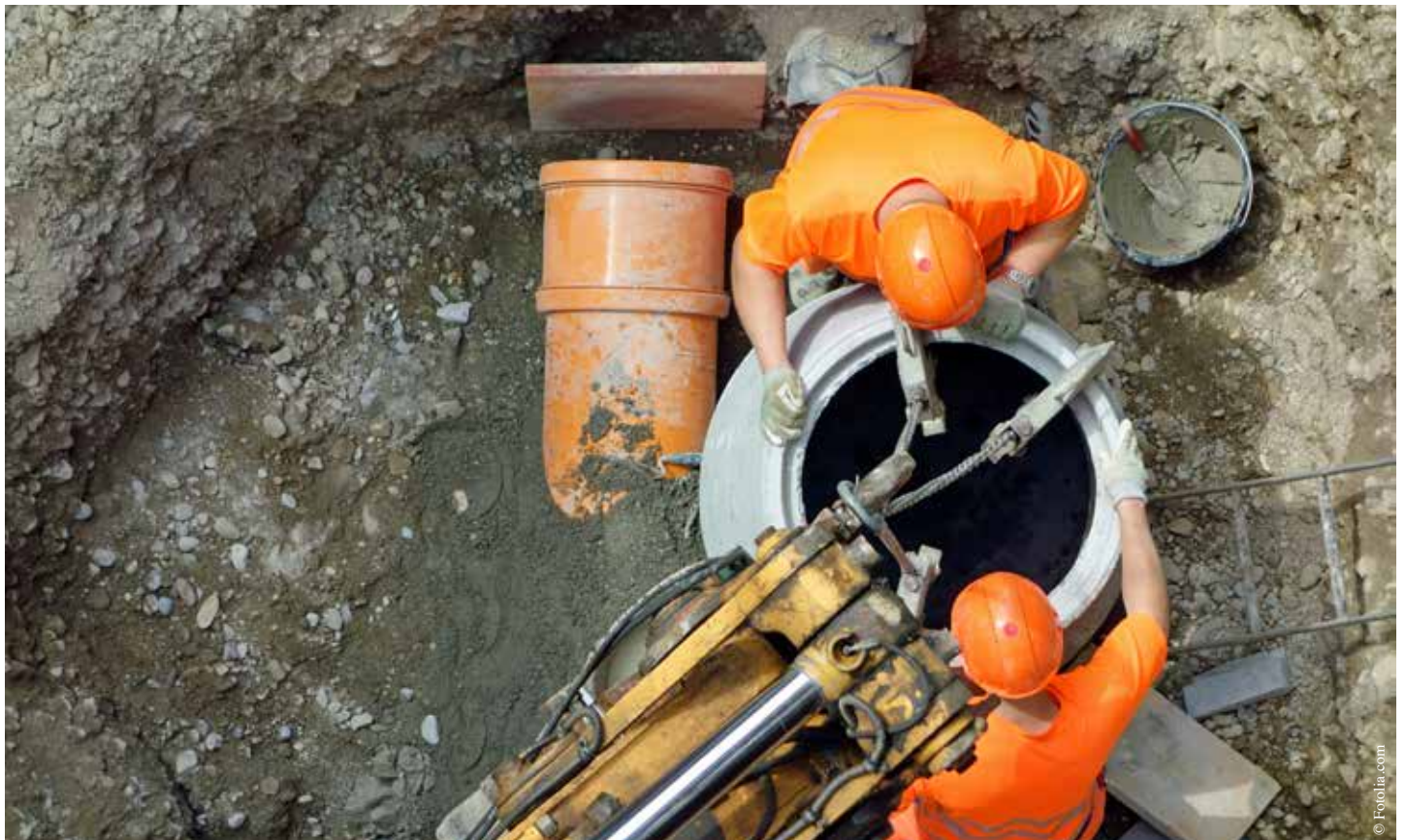
Des travaux de remise aux normes doivent être réalisés sur les systèmes d'assainissement individuels.

Si votre maison n'est pas raccordée au tout-à-l'égout, votre système d'assainissement nécessite peut-être des travaux de remise aux normes. L'Agglomération et l'Agence de l'eau Loire Bretagne peuvent vous aider à les financer.