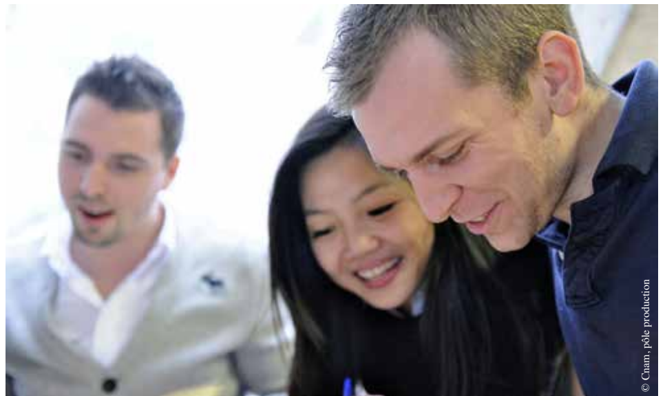
Le Cnam propose des formations pour tous.

La loi de 2014 sur la formation professionnelle vise à faciliter l'accès à la formation de tous les actifs, salariés et demandeurs d'emploi. Le CPF est une nouvelle modalité créée par cette loi. Il a pour ambition d'accroître le niveau de quali-