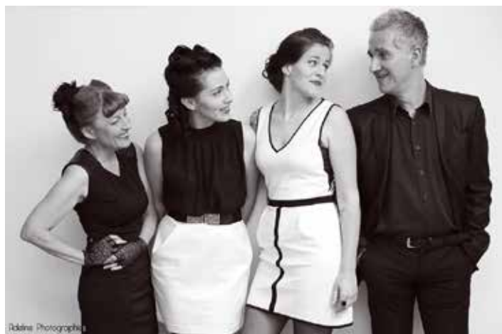
Les Glam'S & Mister'O.