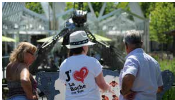
N'hésitez pas à demander conseil aux agents d'accueil présents sur la place Napoléon.

Billetterie auprès de l'Office de tourisme et sur place.