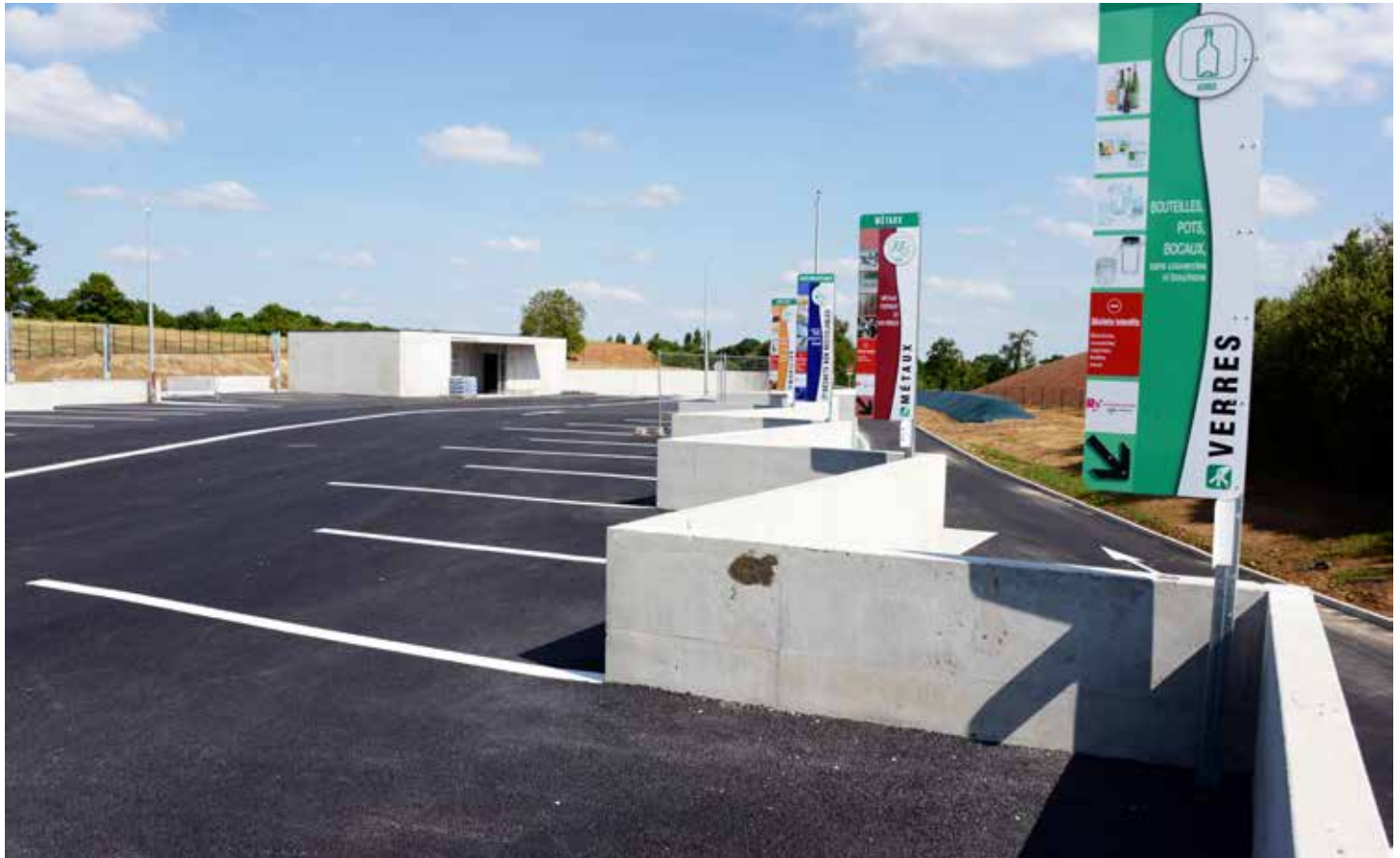
La circulation des usagers a été améliorée sur la plateforme de la déchetterie de Sainte-Anne.

A fin d'améliorer l'accueil et la sécurité des usagers, la déchetterie de Sainte-Anne a fait l'objet de travaux de modernisation pendant sept mois. Elle sera de nouveau accessible à partir du vendredi 10 juillet.