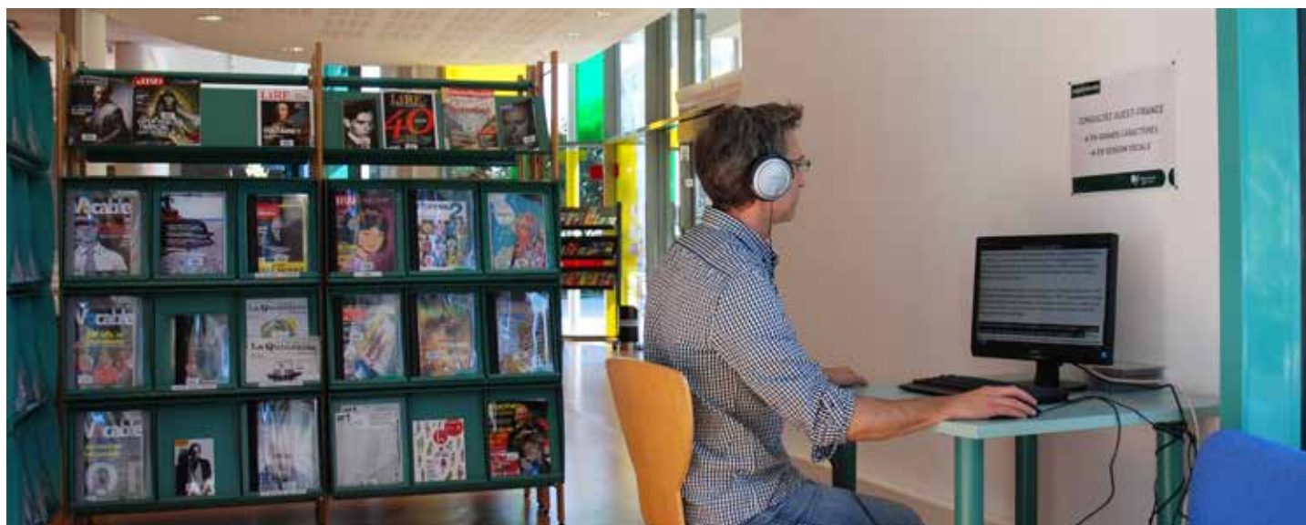
Bénéficiez de Ouest-France en version parlée à la médiathèque Benjamin-Rabier.

Les médiathèques proposent également des magazines ( Mieux Voir et Largevision ), près de 3 000 livres en grands caractères et plus de 750 CD de textes lus (fictions et documentaires).