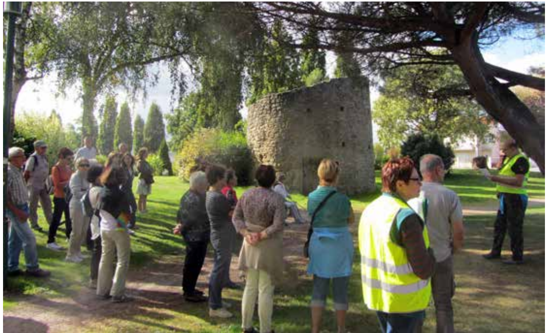
Promenade yonnaise dans le quartier de la Vallée-Verte.

Contact : renseignements et inscription au 02 51 36 90 00