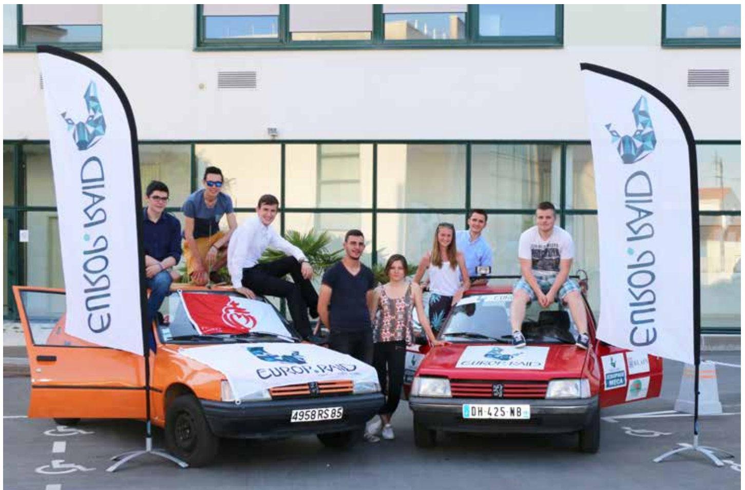
Les équipages de l'Europ'Raid sont prêts pour 23 jours d'aventure.

Contact : www.europraid.fr et sur www.facebook.com/EuropRaid