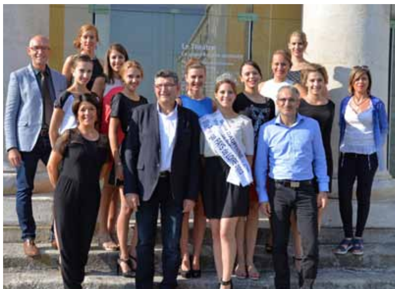
La sélection des candidates a eu lieu le 13 septembre dernier en présence du maire et de représentants des commerçants.

Tarifs : 20 € ; 10 € pour les moins de 8 ans. Réservation à l'Office de tourisme, au 02 51 36 00 85