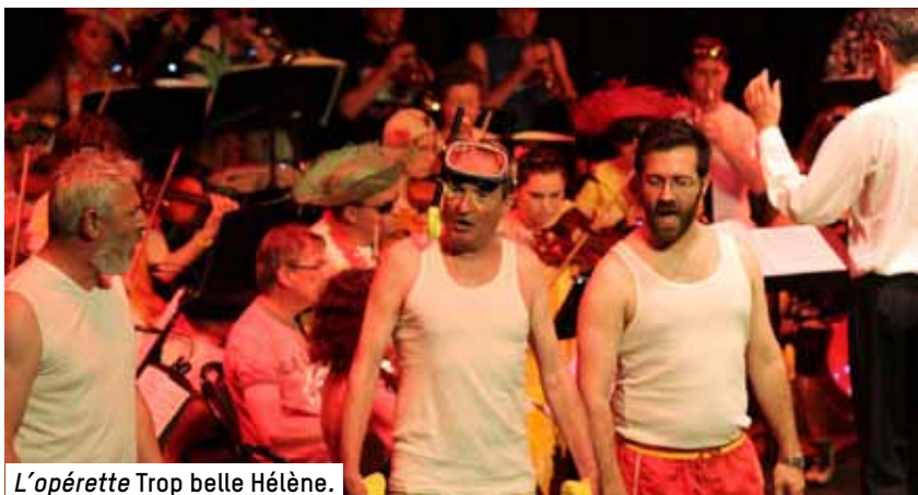
L'opérette Trop belle Hélène .