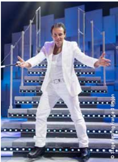
Philippe Candeloro, invité d'honneur des Rencontres Racines.

Prendre soin de soi est une priorité à tous les âges de la vie, mais cela devient un enjeu clef lorsque ce message s'adresse aux seniors.