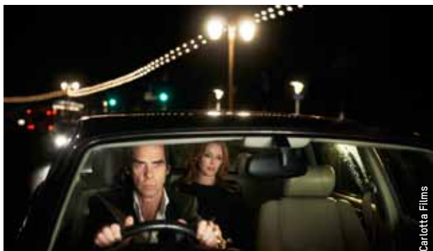
20 000 jours sur Terre de Iain Forsyth et Jane Pollard.

Ces séances mettent à l'honneur des films incroyables, par leur durée ou leur côté spectaculaire, ainsi que des films de réalisateurs passés « maîtres ». Des séances spéciales, car exceptionnelles, particulières et déconcertantes.