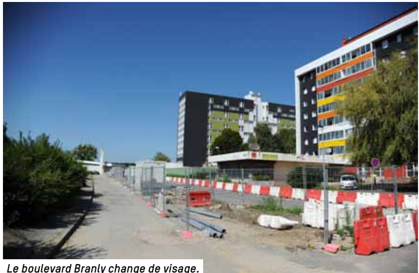
Le boulevard Branly change de visage.