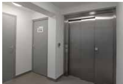
La salle Rivoli dispose désormais d'un ascenseur pour l'accès au premier étage.

« Un état des lieux de l'ensemble des équipements sportifs yonnais, qui