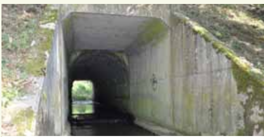
Une structure sera aménagée dans l'ouvrage d'art existant afin de permettre le passage « au sec » des animaux.

Coût du projet : 34 918,60 € TTC financé par la Ville, subventionné à 80 % par la Région des Pays de la Loire. ■