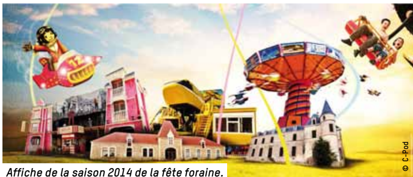
Affiche de la saison 2014 de la fête foraine.

L a fête foraine d'automne s'installe du 24 octobre au 11 novembre sur le parking du parc des expositions des Oudairies. Le site est desservi par la ligne de bus n° 6.