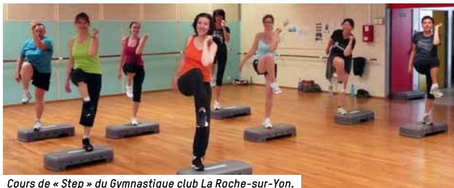
Cours de « Step » du Gymnastique club La Roche-sur-Yon.

GCRY, salle Jean-Garcette, 8, impasse Caillé, au 02 51 36 21 14 ou 02 51 34 19 32 ou 02 51 37 80 37 et sur www.gcry.fr COURRIEL : gcry@hotmail.fr ou chantal.prineau@aliceadsl.fr ou smorineau19@yahoo.fr