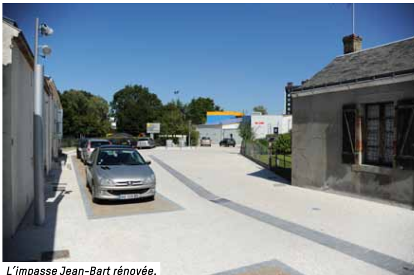
L'impasse Jean-Bart rénovée.

Afin de faciliter le relogement des derniers habitants de la résidence Forges A, les travaux de déconstruction, initialement prévus pour septembre, sont reportés en novembre 2014. La déconstruction de Forges A doit être achevée pour mai-juin 2015 (environ 6 à 7 mois de travaux). ■