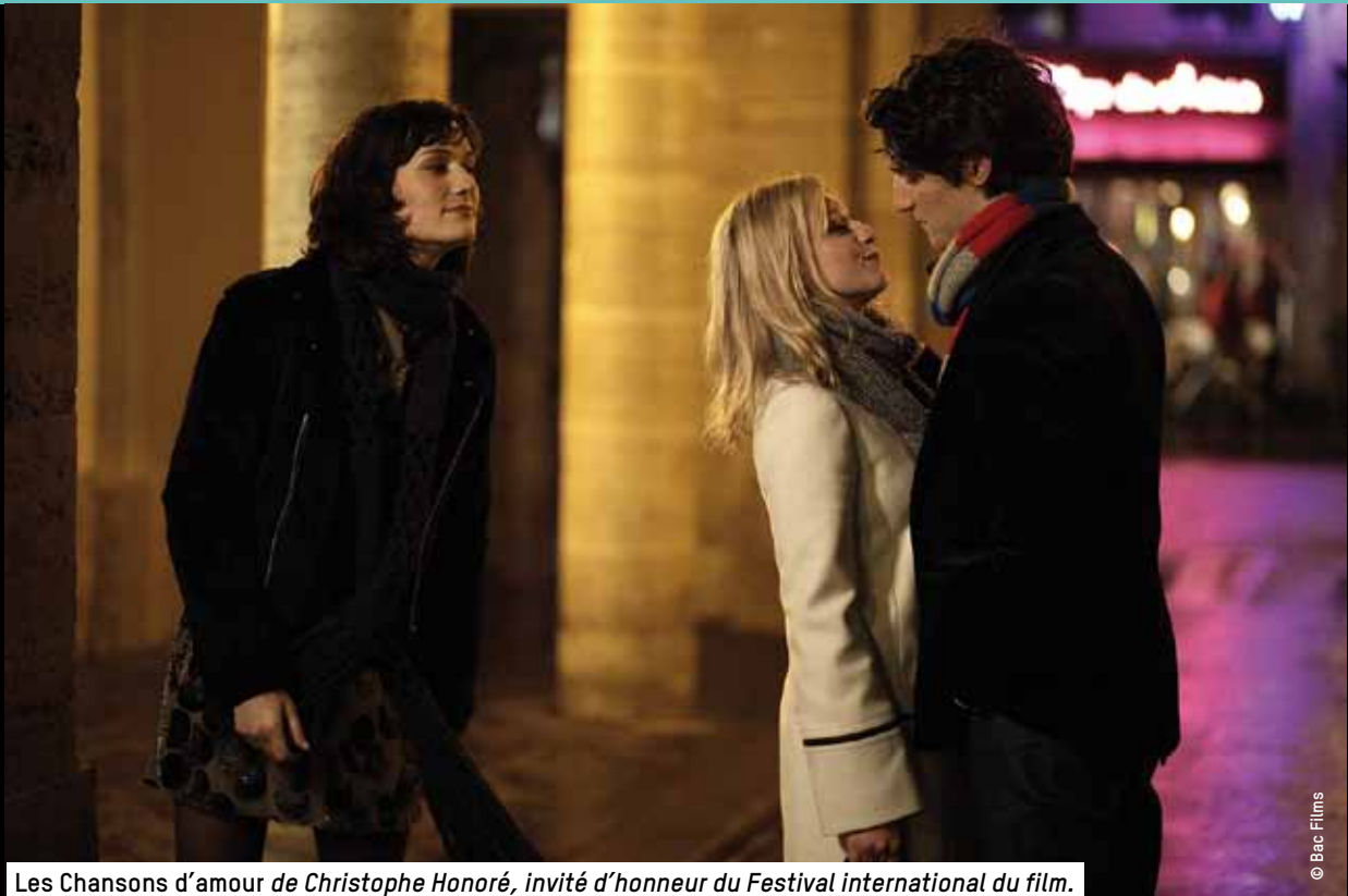
Les Chansons d'amour de Christophe Honoré, invité d'honneur du Festival international du film.