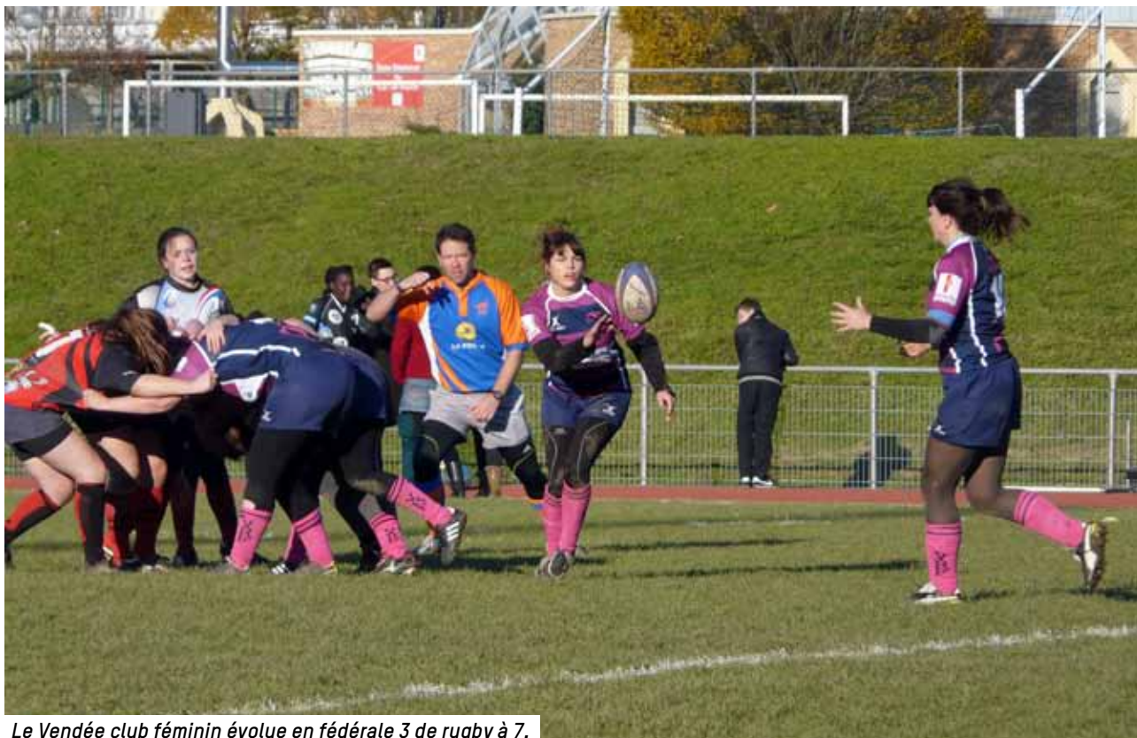
Le Vendée club féminin évolue en fédérale 3 de rugby à 7.

Vendée rugby féminin, au 06 63 40 07 85 et sur Facebook Vendée Rugby Féminin COURRIEL : vendeerugbyfeminin@live.fr